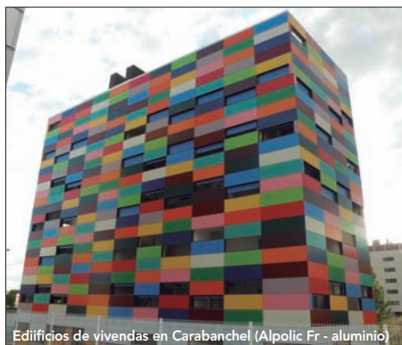
Edificios de viviendas en Carabanchel (Alpolic Fr - aluminio)

La empresa Priplastic fue fundada en Mungía (Vizcaya) por la familia Prieto en el año 1992, dedicándose a la distribución de recubrimientos para fachadas ventiladas en el País Vasco y Navarra. En el año 1998 empezó a realizar el mecanización de las piezas para aportar un mejor servicio a sus clientes, adquiriendo maquinaria con control numérico.