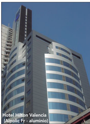
Hotel Hilton Valencia (Alpolic Fr - aluminio)

En la actualidad, Priplastic centra su actividad en el suministro de los paneles composite de la marca Mitsubishi, poniendo gran énfasis en su producto estrella, Alpolic Fr. Esta solución se destaca como un recubrimiento ideal tanto para fachadas exteriores y muros cortina como en decoración interior, con las ventajas habituales que aportan las fachadas ventiladas (a nivel estético, así como protección frente a la humedad, aislamiento térmico,...). Asimismo,